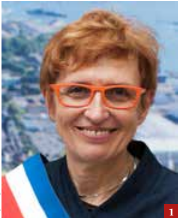
Reportage D. Pascal