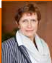
Thérèse Thiéry maire de Lanester