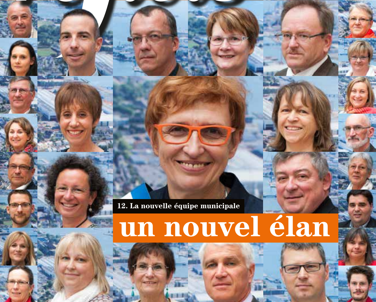
12. La nouvelle équipe municipale