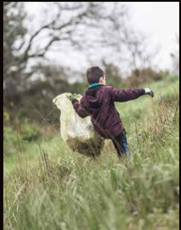
↑ ↗ → Le 6 avril dernier, une centaine de Lanestériens ont participé au traditionnel nettoyage de Printemps