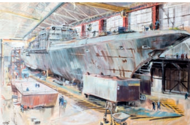
Frégate en construction de Anne Smith, 2012