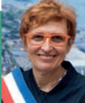
Thérèse THIÉRY maire de Lanester