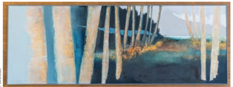
Peinture de Dominique Haab-Camon, 2001

Suite à une double exposition réalisée à la Rotonde et dans le Hall de l'Hôtel de Ville, cette