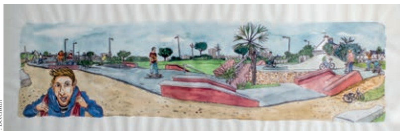
Regards sur la Ville de Laurent Lolmède, 2014

LE LIVRE D'ARTISTE En plus de ces œuvres, la Municipalité possède une centaine de livres d'artistes qui sont des œuvres d'art prenant la forme ou adoptant l'esprit d'un livre. Conservés à la Médiathèque, ils sont consultables sur place et offrent un support différent pour découvrir le travail d'un artiste.