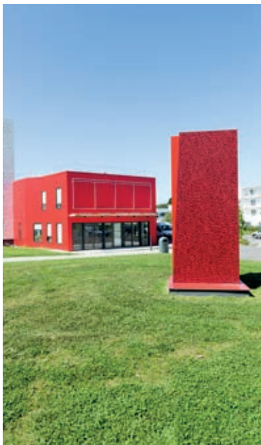
Fil rouge de Thierry Le Saëc, 2013.

De Thierry Le Saëc, 2013. Localisation : Quartier Kesler-Devillers L'œuvre Fil Rouge a été réalisée dans le cadre de la rénovation urbaine du quartier de Kesler-Devillers. Conçue à partir des noms de famille des habitants du quartier, ce "trait d'écriture" décline un cheminement qui fait le lien entre l'Eskale, le quartier et la ville. Constituée de trois éléments, l'œuvre est visible sur les murs intérieurs de l'Eskale ainsi qu'à l'extérieur sur le totem et le long d'un parcours piéton.