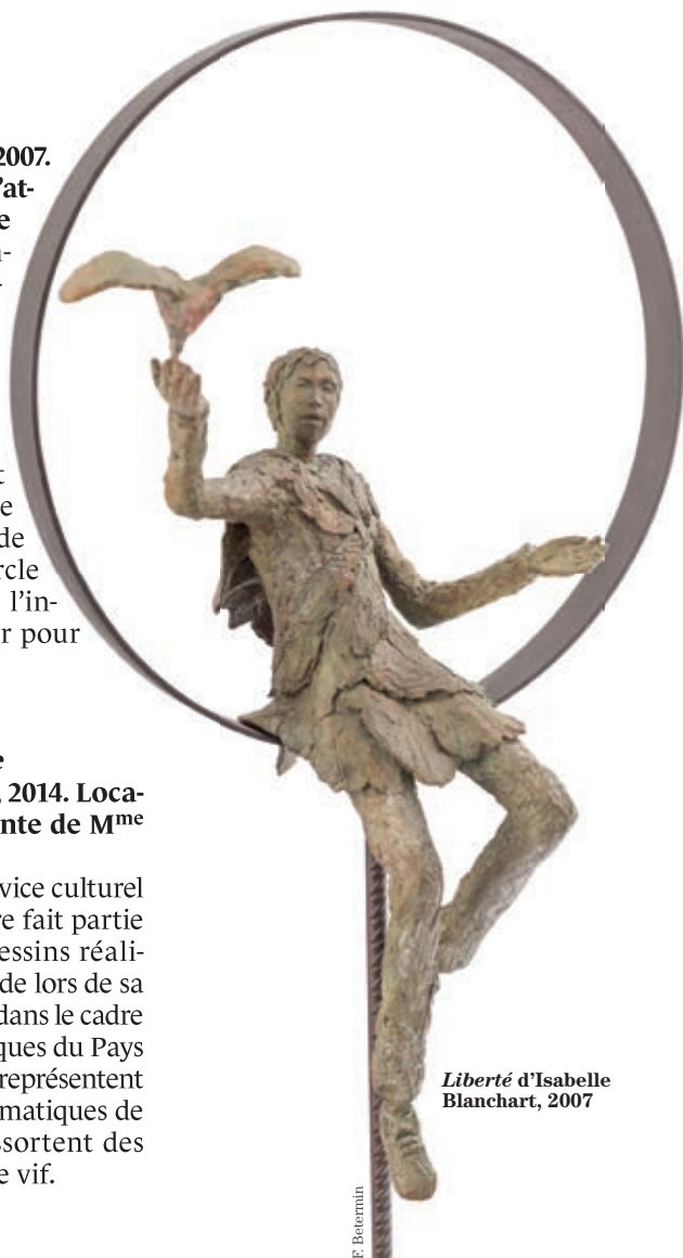
Liberté d'Isabelle Blanchart, 2007

Commandée par le service culturel de la Ville, cette œuvre fait partie d'une série de cinq dessins réalisés par Laurent Lolmède lors de sa venue en mars dernier dans le cadre des Itinéraires Graphiques du Pays de Lorient. Ces dessins représentent des lieux de vie emblématiques de la commune d'où ressortent des ambiances prises sur le vif.