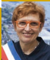
Thérèse THIÉRY maire de Lanester