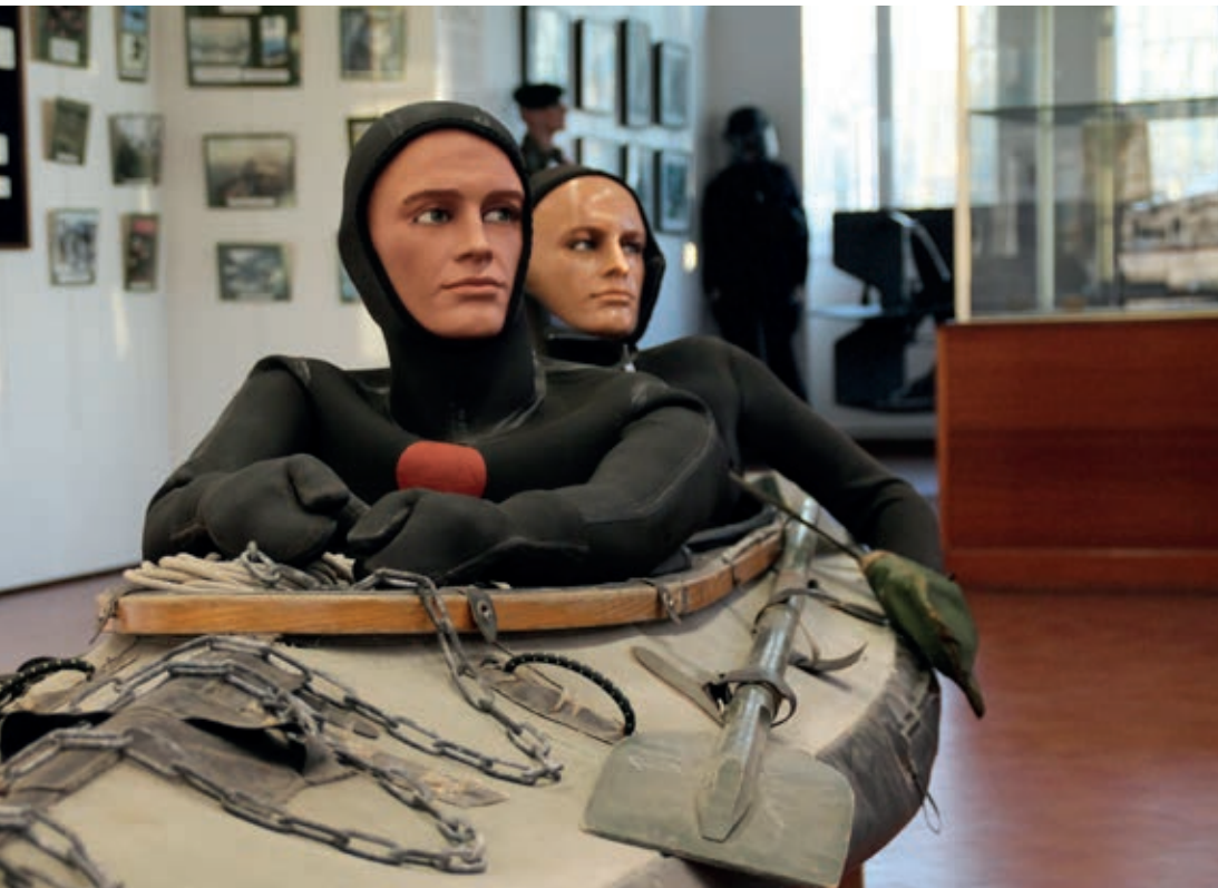
Ministère de la défense, Musée de tradition des fusiliers marins