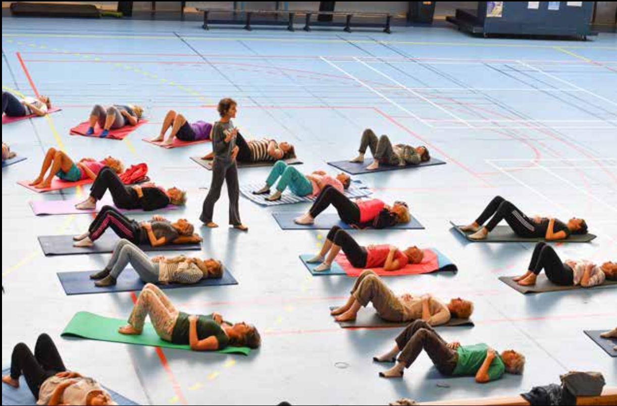
Repli au gymnase Jean-Zay pour une des activités gratuites "sport bien-être" des dimanches de juin. ←