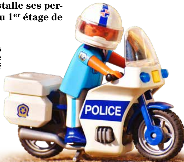
Complémentaires, les Polices nationale et municipale tiennent des permanences à l'Hôtel de Ville de Lanester.

Trois demi-journées par semaine, lors de leurs permanences, les agents de la Police nationale enregistrent les dépôts de plainte et les mains courantes. Pour gagner du temps, il est possible d'effectuer une pré-plainte en ligne sur le site pré-plainte-enligne.gouv.fr. Chaque jour, les trois policiers municipaux accueillent le public et le renseignent sur le sta-