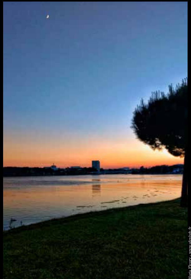
↑ → Balades ensoleillées sur les rives du Scorff et du Blavet...