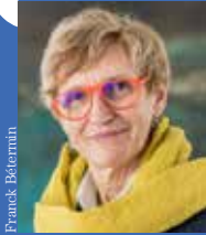
Thérèse THIÉRY maire de Lanester