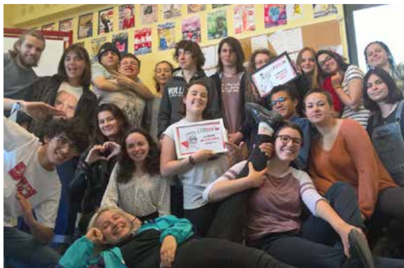
Des journalistes en herbe multi-récompensés.