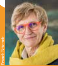
Thérèse THIÉRY maire de Lanester